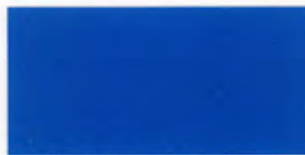
U-01 ロイヤルブルー [透光率 0.0%]