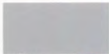
U-19 グレー [透光率 1.2%]