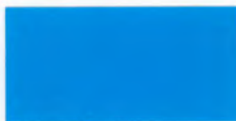
U-02 ライトブルー [透光率 0.8%]