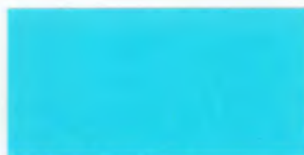
U-03 アクアブルー [透光率 3.9%]