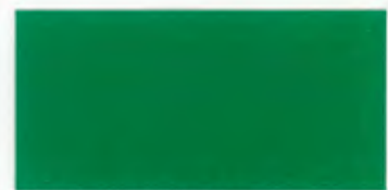
U-09 フォレストグリーン [透光率 0.1%]