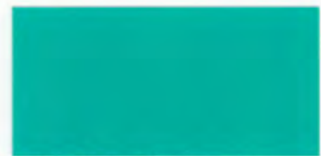
U-08 スカイグリーン [透光率 0.6%]