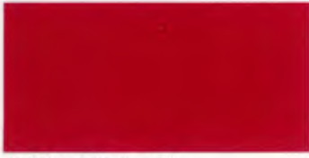
U-30 ワインレッド [透光率 0.4%]