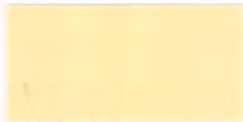
U-16 ベージュ [透光率 7.4%]