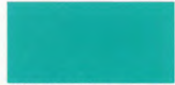
U-04 エメラルドグリーン [透光率 0.5%]