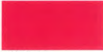
U-28 ピーチ [透光率 1.7%]