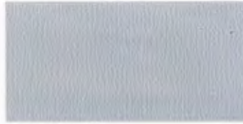
U-21 シルバー [透光率 0.0%]