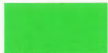
U-10 ライトグリーン [透光率 2.1%]