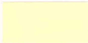
U-31 クリーム [透光率 12.5%]