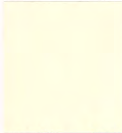
U-17 アイボリー [透光率 10.4%]